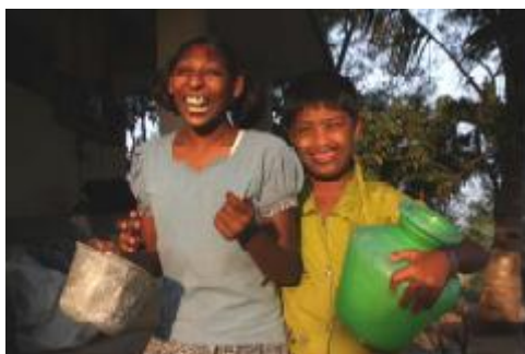
Am Abend helfen die Kinder beim Bewässern der Pflanzen im Garten von ELIM.

Die Ruck-Zuck-Band musizierte bei diesem Gottesdienst für das Projekt ELIM in Südindien .