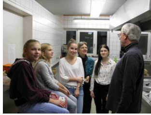
Textquelle: Rügen Leicht