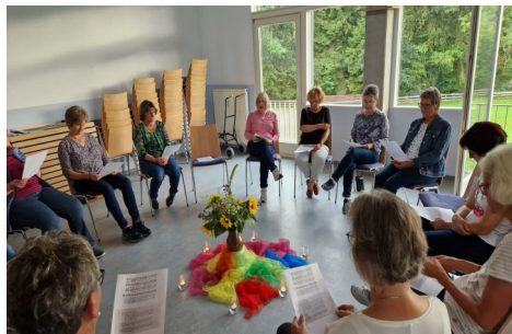
Ök, Frauengruppe Atempause, privat

Für alle die eine Sehnsucht nach Gott haben. Kommt einfach und probiert es !