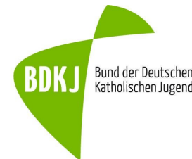
© Bund der Deutschen Katholischen Jugend (BDKJ)